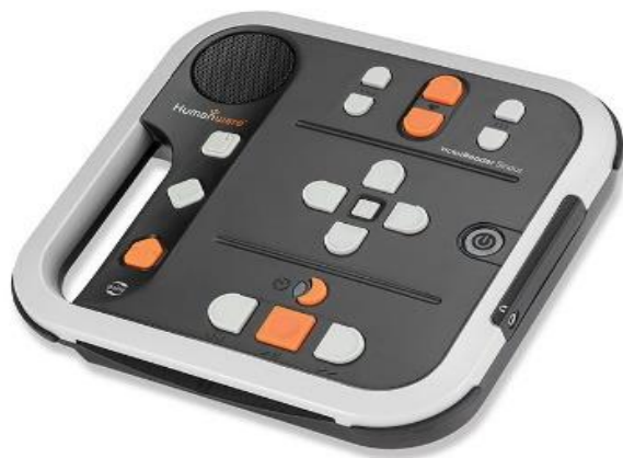
VICTOR Stratus 4M

peuvent être fournis par la Bibliothèque Sonore à prix coûtant (450€ l'unité), ou, pour les audio lecteurs à faible ressources, sur présentation d'un avis de non-imposition, mis à disposition, dans le cadre d'une convention de prêt